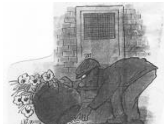
Teks verkort en verwerk uit: BEELD: Jou Geldsake, Donderdag 17 Oktober 2002

15 'n Alarm behoort sy eie reserwekragbron te hê in geval die kragtoevoer afgesny word.